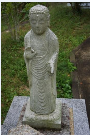
第48番 種類:釈迦如来立像 アクセス:法泉坊・墓地内