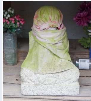
第50番 種類:弘法大師坐像 アクセス:道路わき, 社