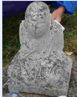
第52番 種類:弘法大師坐像 アクセス:道路わき, 供養塔