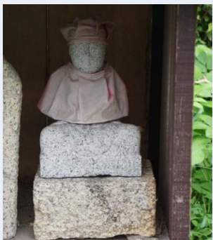
第45番 種類:弘法大師坐像 アクセス:道路わき, 社