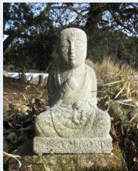
第49番 種類:弘法大師坐像 アクセス:民家裏, 墓地内