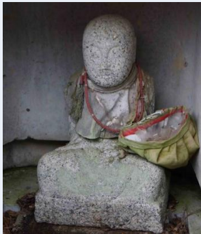
第46番 種類:弘法大師坐像 アクセス:道路わき, 社