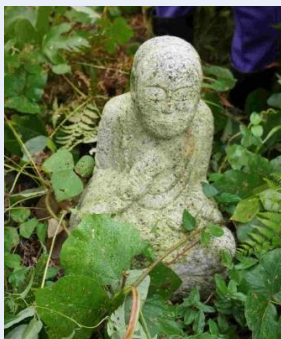
第47番 種類:弘法大師坐像 アクセス:民家横の丘